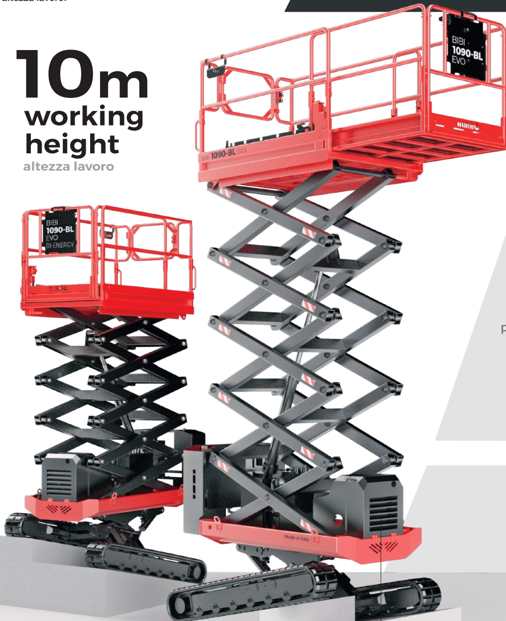
KUBOTA Diesel Z602