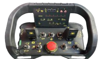
Radio console by AUTEK Console radio by AUTEK